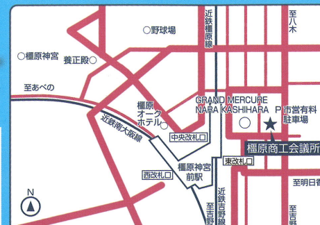
近鉄橿原神宮前駅 東改札口より徒歩1分