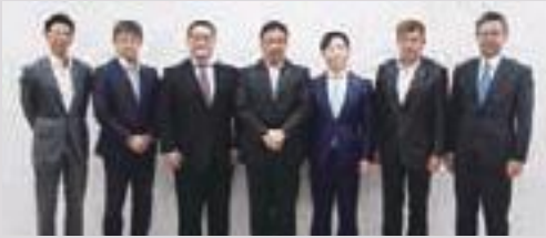
亀田市長表敬訪問(米良会長:右から3番目)