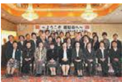
▲他商工会議所女性会との交流会