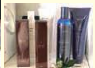
▲オリジナルブランドシャンプー