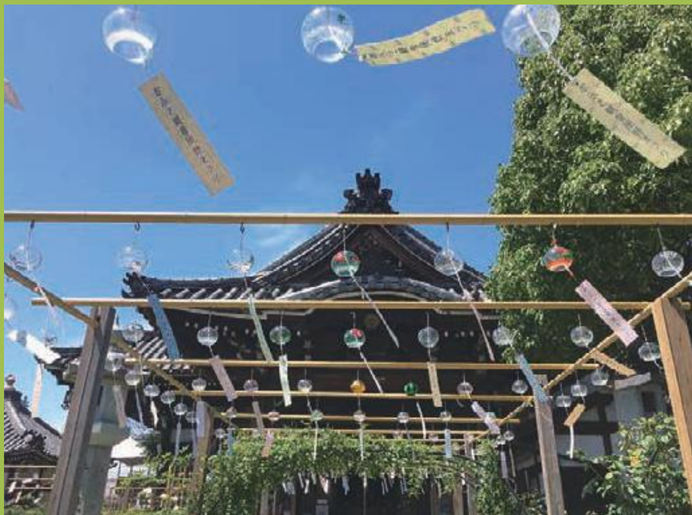
おふさ観音風鈴まつり