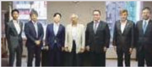
森本会頭表敬訪問(米良会長:左から3番目)