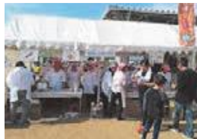
▲飛鳥 RUN×2 リレーマラソンに出展

一泊研修として各地の施設見学を行い、地域産業を学んでいます。また、各地の商工会議所女性会と交流事業を行っています。