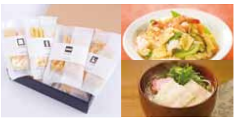
贈答用乾燥湯葉セットNA (3,045円)

当店は、創業以来、湯葉一筋の専門店です。そこで今回ご紹介の贈答用乾燥湯葉セットNAは、結び湯葉、小巻湯葉、きざみ湯葉(以上はカナダ産大豆)と国産大豆100%の色志湯葉がセットになった商品です。湯葉は和洋中折衷に適した食材ですので、あなか中華丼、うどん、そば、鍋物など色々な料理に重宝いたします。また、乾燥湯葉は保存食としても最適です。