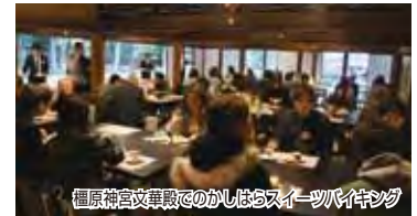
橿原神宮文華殿でのかしはらスイーツバイキング