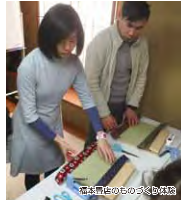
福本畳店のものづくり体験