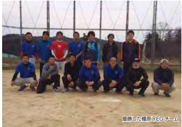
優勝した橿原 YEG チーム

この地域連携親睦スポーツ大会は5団体が集まり、スポーツを通じ楽しみながら交流、地域青年経済人の連携の輪を円滑に進める事業であり親睦を目的としています。今年で5回目の開催となりました。スポーツ大会後は橿原観光ホテルでの懇親会を開催し、優勝した橿原 YEG はトロフィーを持ち帰りました。