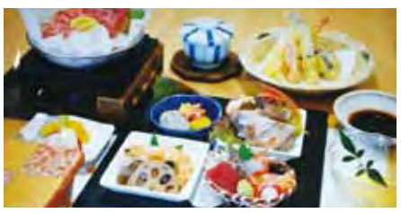
和食はなゆずの おすすめ ¥3,240(税込)

日本料理と言えば、堅いイメージがありますが、私共の店は気軽により多くの方に楽しんで頂く為に低料金で満足してもらえるメニューを考えております。その為、昼も夜も同じメニューを同じ価格で、提供いたします。 小さなお子様も大歓迎です。御家族や女子会、法事、お祝い事等御相談いただければ、対応させていただきます。どうぞ宜しくお願い致します。