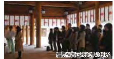
橿原神宮正式参拝の様子