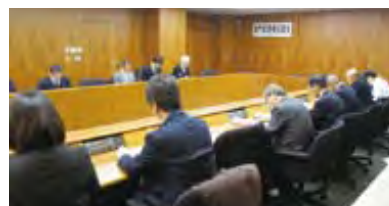
連携協議会の様子