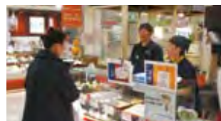
伝統食カフェ～楽膳～ 販売風景