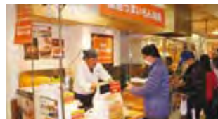
薄皮たい焼 粉こ楽 販売風景