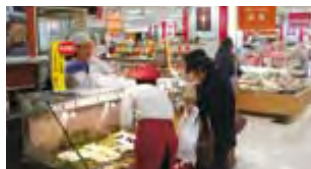
今井十返舎 販売風景

平成29年2月8日（水）から14日（火）の7日間（株）近鉄百貨店橿原店 地下1階食品催事場にて、「橿原うまいもん Week 事業（橿原うまいもん特集）」を開催しました。この事業は例年実施しています「かしはらのうまいもん市」事業を変化させたもので、橿原市内事業所5事業所（今井十返舎、薄皮たい焼 粉こ楽、鈴音堂 橿原の里、伝統食カフェ～楽膳～、パティスリー Neiro）が出展し、たくさんの方の橿原市内外からの来店される方に販売を行うことで事業所のPRの場となりました。