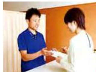
↑ 親身になって対応します