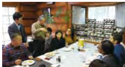
産官学連携(畿央大学)コラボデザート(しょうがを使ったデザート) 説明するカフェレスト陽炎増井店主