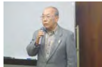
下田サービス業部会会長挨拶

という5つのテクニックポイントで、お客様を身内化することによって、確実に売上を上げる方法を講義して頂きました。セミナー終了後は、佐藤先生と名刺交換されるために長蛇の列ができ、受講生の満足度の高さが伺えました。