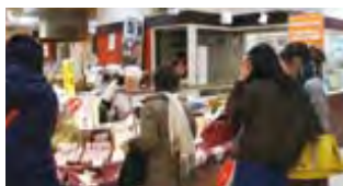
鈴音堂 橿原の里 販売風景