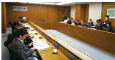
連携協議会の様子

平成29年度におきましても、専門家派遣を実施しつつ小規模事業者をはじめ事業者の支援、相談事業を推進してまいります。