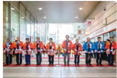
開会セレモニーの様子

平成29年1月18日(水)から1月23日(月)の6日間にわたり、宮崎市の宮崎山形屋にて「榎原市姉妹都市50周年記念 第23回姉妹都市榎原と宮崎の物産展」(主催 榎原市・榎原商工会議所・榎原物産協会・宮崎市・宮崎商工会議所・宮崎物産協会)を開催しました。榎原からは20事業所、宮崎からは26事業所が出展し、毎年この物産展開催を楽しみにされている多くのお客さまのご来場をいただき大いに賑わいました。