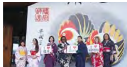
榎原神宮の大絵馬の前での外国人モニター