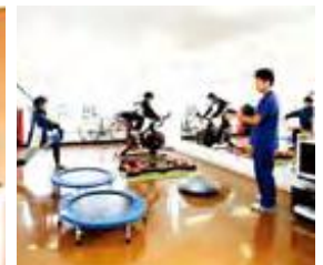
↑ 最大の特徴、スポーツトレーニングジム併設