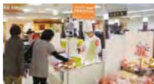
パティスリー Neiro 販売風景