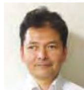
上級ウェブ解析士 医療情報技師

1968 年 明日香村にて出生 1992 年 より、東京にてシステム開発/パソコン及びネットワークの導入・メンテナンス/ホームページ作成等の業務に従事 2013 年 より、橿原市にて独立開業 ホームページ作成・管理業務を中心に、ホームページの多言語翻訳 (英語・韓国語・中国語等)・ウェブ解析によるホームページの改善提案等を行っている。 また、パソコンやネットワークのハードウェアも含めたトラブル対応も得意としており、IT 全般のコンサルティングにも注力している。