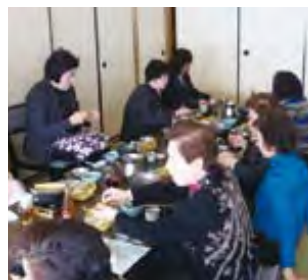
新年懇親会の様子