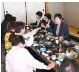
新年懇親会の様子