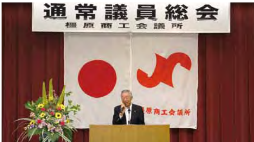
挨拶をする森本会頭

続いて、当日上程された第1号議案：平成27年度事業報告承認について、第2号議案：平成27年度収支決算承認等について、第3号議案：平成28年度収支予算変更について、第4号議案：その他について、原案通り満場一致にて可決承認され、通常議員総会が終了しました。