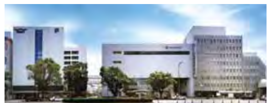
(株) 宮崎山形屋の外観