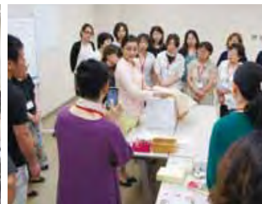
ラッピング実技風景