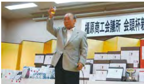
運営主管: 下田サービス業部会長の乾杯挨拶