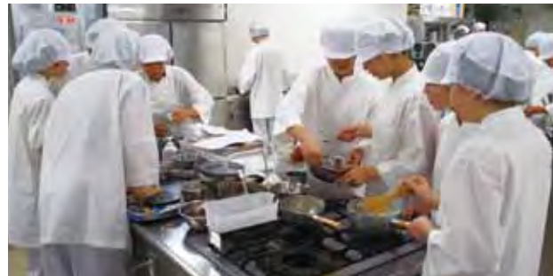
第2回試作会の様子