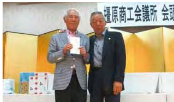
ゴルファーの憧れ「エイジシュート」を達成された宮寄工業部会長(左)とプレゼンターの森本会頭(右)