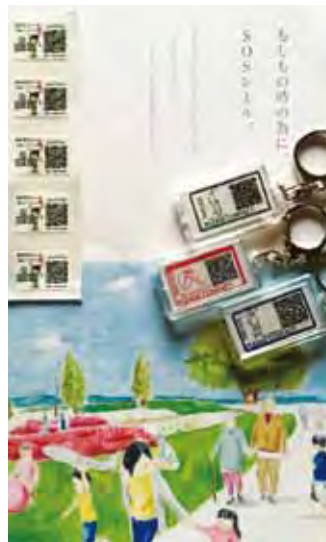
↑ SOS シリールズ