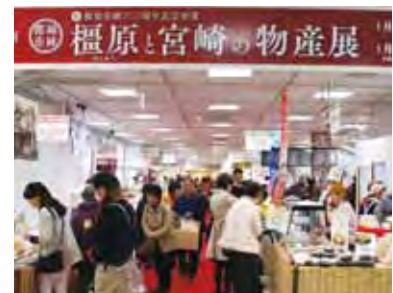
昨年の会場の様子