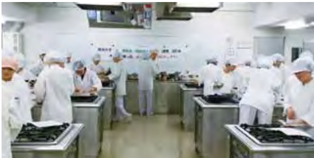
第1回試作会の様子

今後、6月30日(木)の学生創作レシピのプレゼンテーション大会を経て、8月号商工ニュースにおいて、当プロジェクトの参加事業所を募集、9月後半に参加事業所が商品化を目指すレシピを選ぶための審査会を実施する予定です。