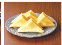
▲厚焼き玉子サンド

所在地 〒634-0006 榎原市新賀町235-8 サニービルTANAKA 1F 定休日 水曜日 TEL 070-2318-5773 営業時間 7:00~18:00