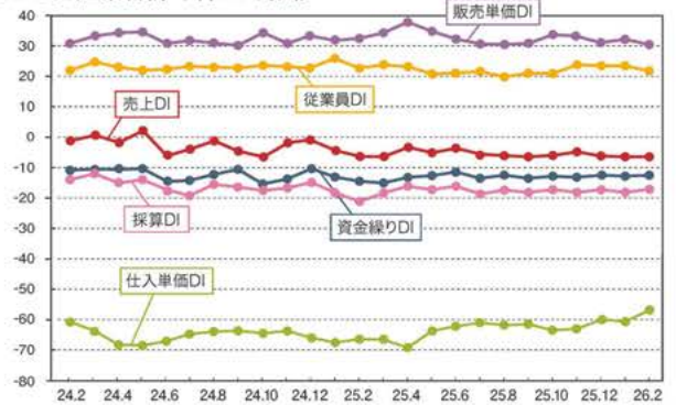
LOBO全産業合計の各DIの推移

※DI値(景況判断指数)について/DI値は、業況・売上・採算などの各項目についての、判断の状況を表す。ゼロを基準として、プラスの値で景気の上向き傾向を表す回答の割合が多いことを示し、マイナスの値で景気の下向き傾向を表す回答の割合が多いことを示す。したがって、売上高などの実数値の上昇率を示すものではなく、強気・弱気などの景況感の相対的な広がり意味する。DI=(増加・好転などの回答割合)-(減少・悪化などの回答割合)