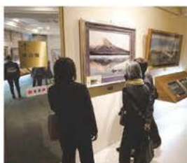
▲ 県外研修（視察）の様子

女性会とは？ 多種多様な業種からなる女性経営者等が集う団体です。 女性経営者として頑張っている方、夫の会社を支えている方、新たに事業を起した方など、各々違った立場で経営に携わっている女性メンバーが集まっています。 様々な事業を通じて自己研鑽、相互交流に努めています。 私たちと一緒に活動してみませんか。