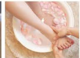
分からない方には説明動画もお送りさせていただきます

所在地 〒634-0821 榎原市西池尻町215-1 グレイス神宮西口102 定休日 不定休 TEL 080-2421-0624 営業時間 お電話にてお問い合わせ下さい。ご希望に沿うよう調整いたします。