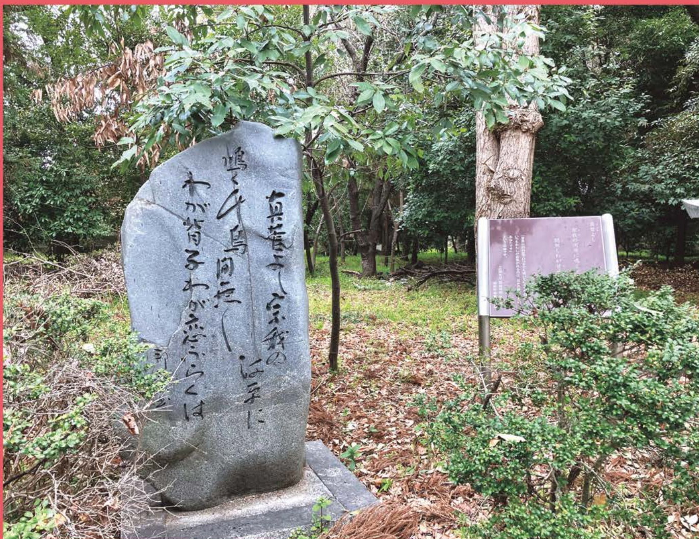
万葉歌碑（作者不詳）（中曾司町 磐余神社境内 令和8年3月18日撮影）