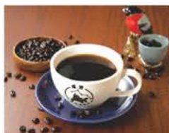
▲オリジナルブレンド