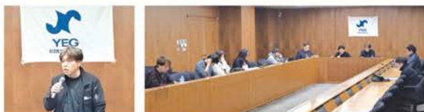
▲ 挨拶する大西会長 ▲ 役員会の様子