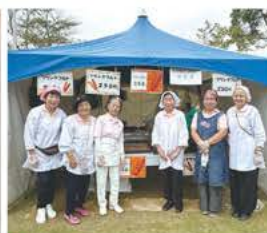
▲ 地域イベントに参加