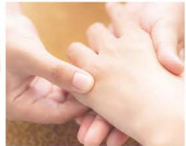
全てのコースに、お客様に合ったセルフケア付きです