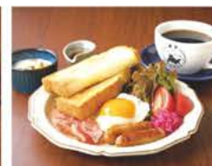
▲モーニングプレート