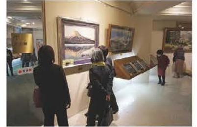
▲視察の様子(京しゅう美術館)