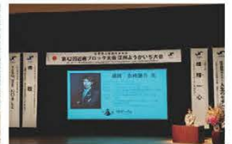
▲第1分科会(記念講演会)の様子