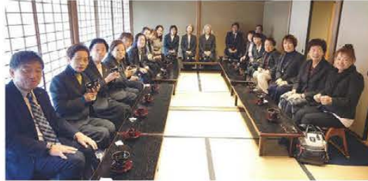
▲視察の様子(高台寺)