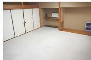
■和室 椅子・机を置くことも可能です(7.36坪)