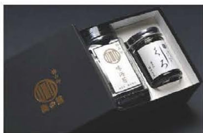
▲慶弔・贈答に「極み印詰合せ」