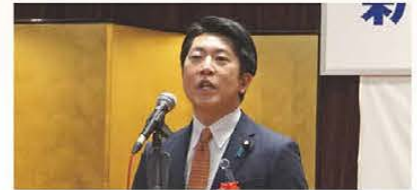
▲佐藤参議院議員のご祝辞