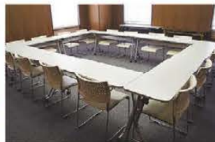
■会議室A (レイアウト例)口型式(18坪)