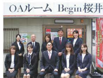
▲スタッフ集合写真