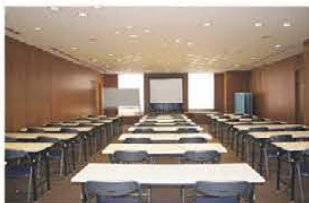
■多目的スペース (レイアウト例)学校式(30坪)