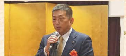
▲亀田市長のご祝辞