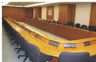
■特別会議室 口型固定式(42坪)