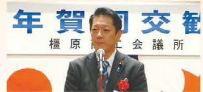
▲田野瀬衆議院議員のご祝辞