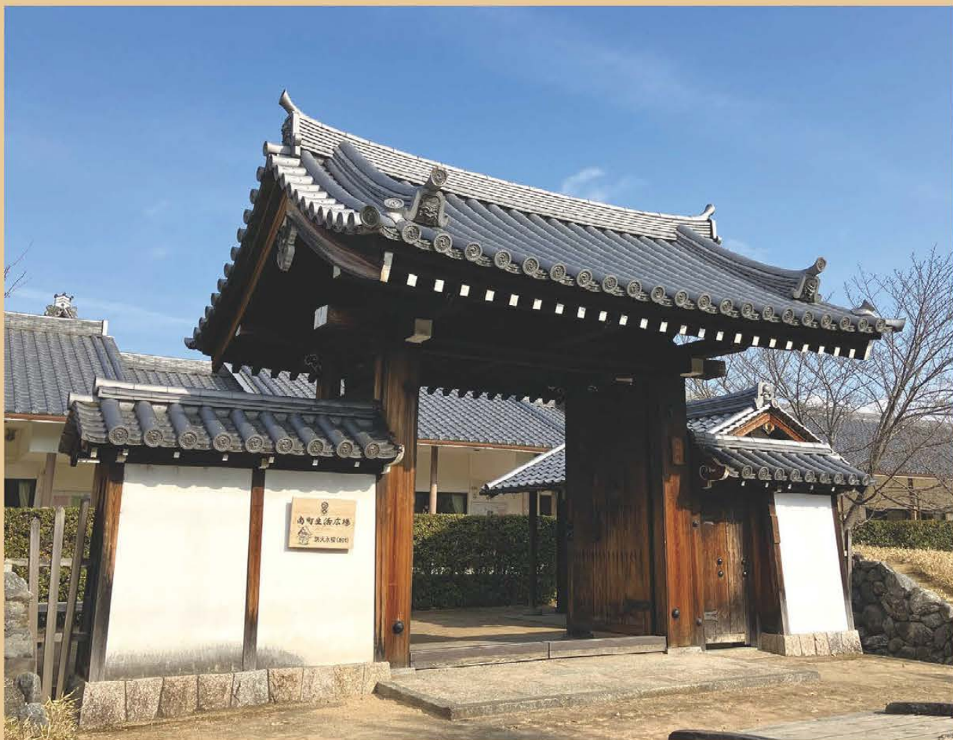
南町生活広場の門（今井町 令和7年1月14日撮影）

今井町には、江戸時代、9ヶ所の門がありましたが、現在1ヶ所のみ復元整備し、活用しています。