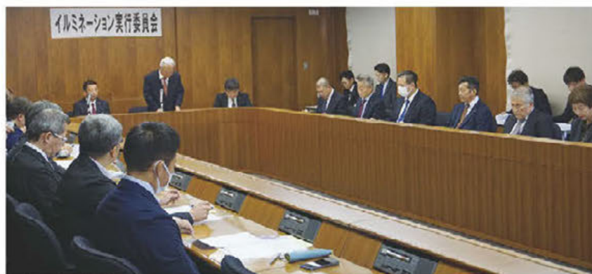
▲実行委員会の様子