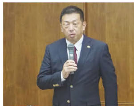
▲挨拶する亀田名誉会長(榎原市長)