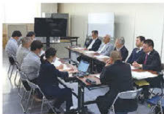
▲意見交換会の様子

意見交換では、令和6年度に提出した建設関連要望に対する橿原市契約検査課での現状の対応内容が説明され、要望に関して当所建設業部会と橿原市建設業協会へヒアリングが行われた。また、現在の建設業の経済状況等について意見交換が行われました。