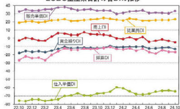
LOBO全産業合計の各DIの推移

※DI値(景況判断指数)について/DI値は、業況・売上・採算などの各項目についての、判断の状況を表す。ゼロを基準として、プラスの値で景気の上向き傾向を表す回答の割合が多いことを示し、マイナスの値で景気の下向き傾向を表す回答の割合が多いことを示す。したがって、売上高などの実数値の上昇率を示すものではなく、強気・弱気などの景況感の相対的な広がりを見極める。DI= (増加・好転などの回答割合)-(減少・悪化などの回答割合)