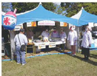
▲地域イベントに参加