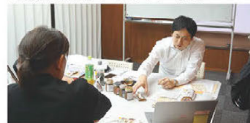
▲商談会の様子((株)柳生屋フーズ)