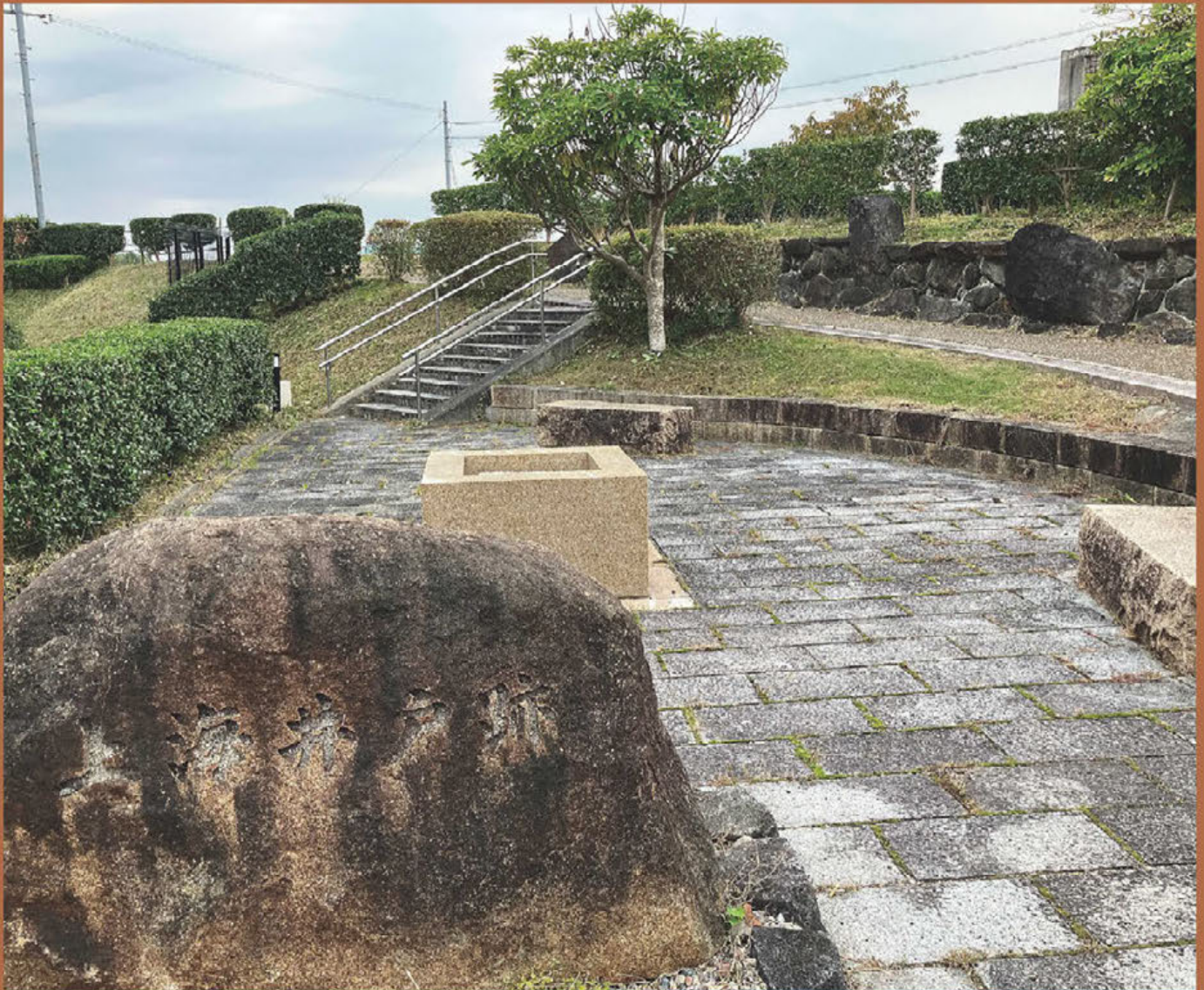
上海井戸跡 (曾我町 令和6年11月12日撮影)

『ここは、古来より此の方、米作りの灌漑用水とし絶えることなく湧水として、農民を育ててくれた「上海井戸」の跡地です。先人達は、この井戸を「命の恩人」と称して大切に守り続けてきました。どんなに日照りが続いても、田植えが出来、豊かな稔りを与えてくれました。』