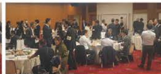
▲第2部 全体交流の様子