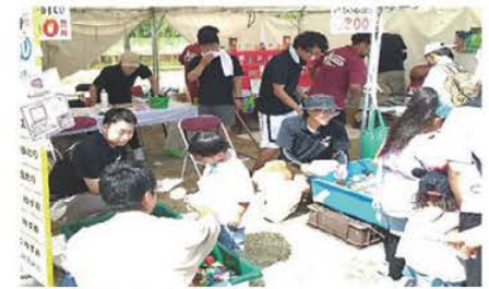
▲なら奈良まつり出店