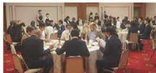
▲第1部 グループ交流の様子