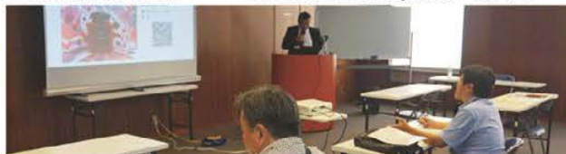
▲プレス発表の様子