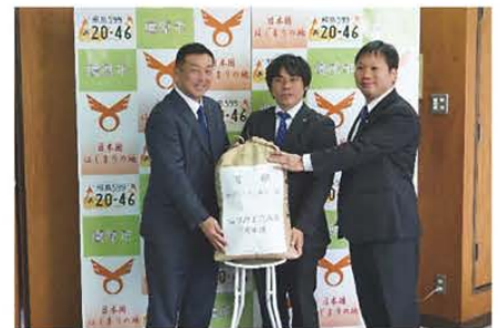
▲お米を寄贈する様子