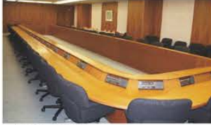
■特別会議室 口型固定式(42坪)

令和6年3月31日をもって、夜間及び休日(土・日・祝日)貸出を終了させていただきました。 平日営業日(9:00~17:00)はこれまで通りご利用いただけます。 今後ともご愛顧いただきますようよろしくお願いいたします。