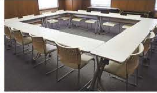
■会議室A <レイアウト例>口型式(18坪)