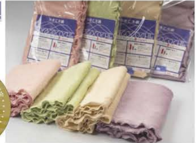
▲「やまと木綿 SOraGOCOCHI 超吸水タオル」

弊社は、大正 10 年タオル製造業として創業し、蚊帳織物、丸編み生地、経編生地製造と変遷してきました。現在は経編を主体に、ニットで繊維商品及び寝具を製作。短繊維使いのトリコットについては、日本でもトップ企業であると自負しています。糸から縫製まで、すべてを自社で行うことにより発想力の高い商品の開発を実現。柔らかさや、心地よさなどを追求した商品を取り揃えております。新商品の企画・製造も承っております。