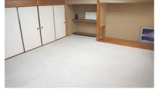
■和室 椅子・机を置くことも可能です(7.36坪)