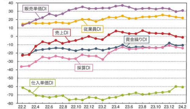
LOBO全産業合計の各DIの推移

※DI値(景況判断指数)について/DI値は、業況・売上・採算などの各項目についての、判断の状況を表す。ゼロを基準として、プラスの値で景気の上向き傾向を表す回答の割合が多いことを示し、マイナスの値で景気の下向き傾向を表す回答の割合が多いことを示す。したがって、売上高などの実数値の上昇率を示すものではなく、強気・弱気などの景況感の相対的な広がり意味着。DI = (増加・好転などの回答割合) - (減少・悪化などの回答割合)