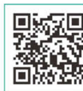
小規模事業者 持続化補助金専用HP

※申請に関して、様式4（事業支援計画書）の発行がありますので、 榎原商工会議所 HP もご確認ください。