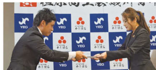
▲入会証を授与する様子