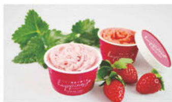
▲自家製ジェラート