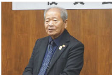
▲挨拶する森脇副会頭