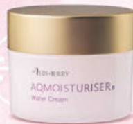
AQMOISTURISER® Water Cream アクモイスタライザー 保湿水分クリーム