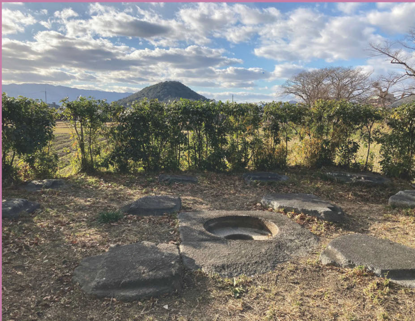
もとやくしじあと 本薬師寺跡 東塔塔心礎と畝傍山（城殿町 令和6年1月16日撮影）