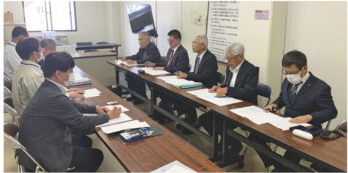
▲意見交換会の様子

意見交換では、令和5年度に提出した建設関連要望に関して檀原市契約検査課から項目ごとに詳細内容について当所建設業部会と檀原市建設業協会にヒアリングが行われました。その他、総合評価方式や電子契約等に関して意見交換を行いました。