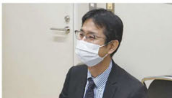
▲(株)日本政策金融公庫 担当者

●連携協定機関/榎原市・株式会社南都銀行・大和信用金庫・奈良中央信用金庫・株式会社りそな銀行 榎原支店・株式会社京都銀行・株式会社日本政策金融公庫 奈良支店