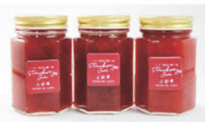
▲まるでイチゴ!の自家製ジャム

橿原市はブランドイチゴの産地として知られていますが、近年生産者の高齢化が進む中、当社は長年培われてきたイチゴ栽培の歴史を継承してきました。夫婦二人三脚で安心・安全で環境と体に優しいをモットーに減農薬でイチゴの栽培をしています。またイチゴの生産をはじめ、ジェラートやジャムの自社工場加工から自社店舗販売にいたるまで丹精込めて行っています。安心・安全なおいしい苺とジェラート・ジャムをぜひお召し上がりください。