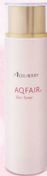
AQFAIR® Skin Toner アクフェア 化粧水