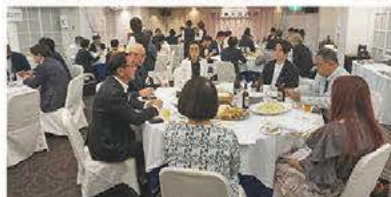
▲第1部グループ交流会の様子