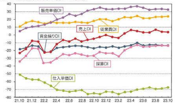
LOBO全産業合計の各DIの推移 (令和5年10月度調査結果)

※DI値(景気判断指数)について/DI値は、業況・売上・採算などの各項目についての、判断の状況を表す。ゼロを基準として、プラスの値で景気の上向き傾向を表す回答の割合が多いことを示し、マイナスの値で景気の下向き傾向を表す回答の割合が多いことを示す。したがって、売上高などの実数値の上昇率を示すものではなく、強気・弱気などの景況感の相対的な広がりを意味する。DI=(増加・好転などの回答割合)-(減少・悪化などの回答割合)