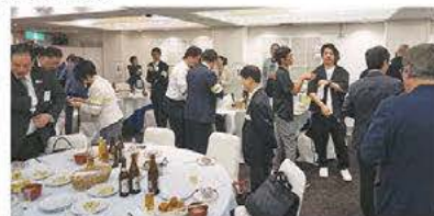
▲第2部 全体交流会の様子