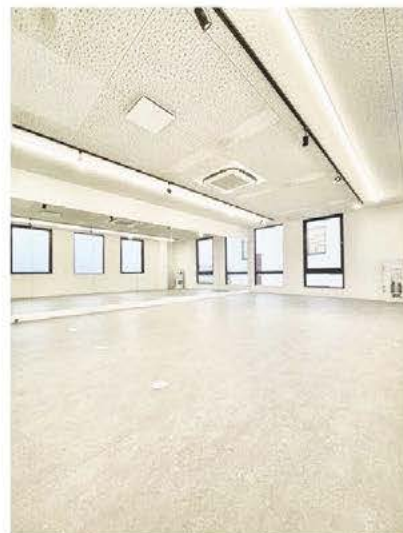
▲レンタルスタジオ