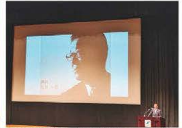
▲第1分科会(記念講演会)の様子