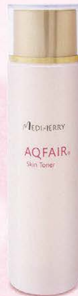
AQFAIR® Skin Toner アクフェア化粧水