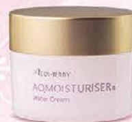
AQMOISTURISER® Water Cream アクモイスタライザー 保湿水分クリーム