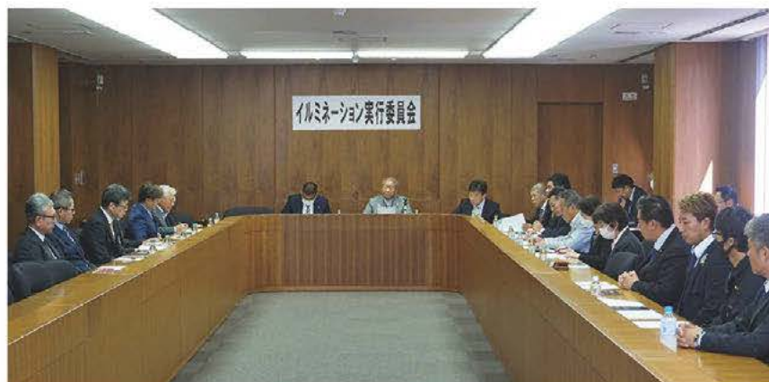
▲実行委員会の様子