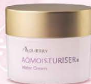
AQMOISTURISER® Water Cream アクモイスタライザー 保湿水分クリーム