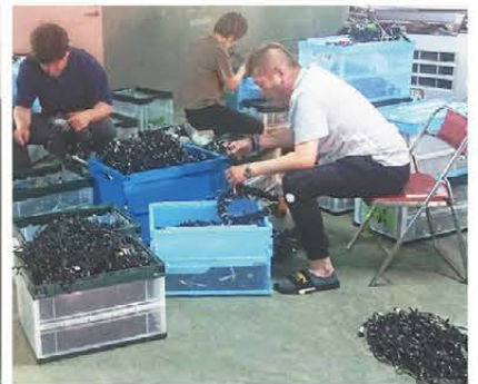
▲点灯チェックの様子