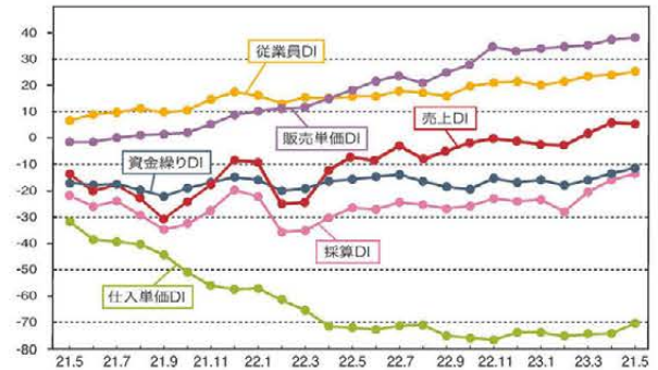
LOBO全産業合計の各DIの推移

※DI値(景況判断指数)について/DI値は、業況・売上・採算などの各項目についての、判断の状況を表す。ゼロを基準として、プラスの値で景気の上向き傾向を表す回答の割合が多いことを示し、マイナスの値で景気の下向き傾向を表す回答の割合が多いことを示す。したがって、売上高などの実数値の上昇率を示すものではなく、強気・弱気などの景況感の相対的な広がり意味着。DI = (増加・好転などの回答割合) - (減少・悪化などの回答割合)