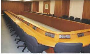
■特別会議室 口型固定式(42坪)

会議、展示会、研修会など規模や目的に合わせて、ご自由にお選びください。榎原商工会議所会員の皆様は特別価格でご利用いただけます。お申込み方法・料金等について、まずはお気軽にお問合せ下さい。