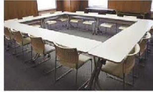
■会議室A (レイアウト例)口型式(18坪)