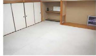
■和室 椅子・机を置くことも可能です(7.36坪)