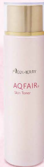
AQFAIR® Skin Toner アクフェア 化粧水