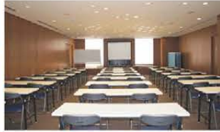
■多目的スペース (レイアウト例)学校式(30坪)