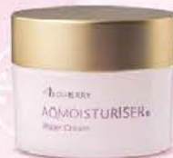
AQMOISTURISER® Water Cream アクモイスチャライザー 保湿水分クリーム