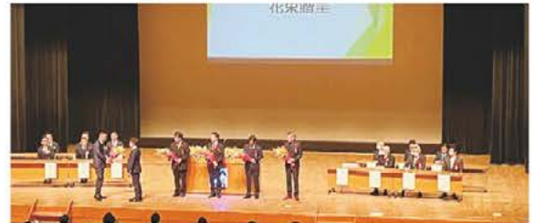
▲歴代会長の紹介の様子