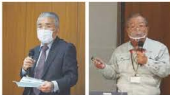
▲響山部会長の挨拶 ▲中川講師