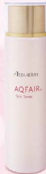
AQFAIR® Skin Toner アクフェア 化粧水