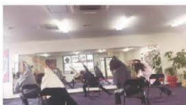
▲チェアヨガクラス