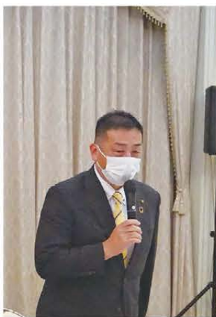
▲挨拶する亀田市長