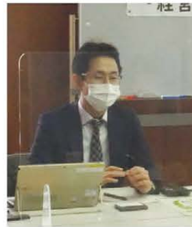
▲株日本政策金融公庫 担当者

事業者が抱える経営課題の解決に向け、金融機関や専門家による個別経営相談会を実施しました。今回は、金融相談、知財相談を実施しました。