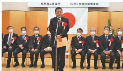
亀田市長よりご祝辞をいただきました