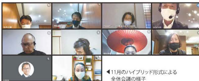
◀11月のハイブリッド形式による全体会議の様子