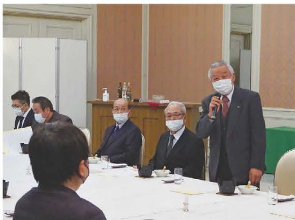
▲挨拶する森本会頭