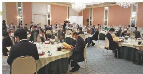
感染症拡大防止対策を徹底して実施しました