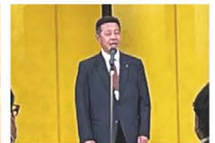
▲挨拶をする木原青商会会長