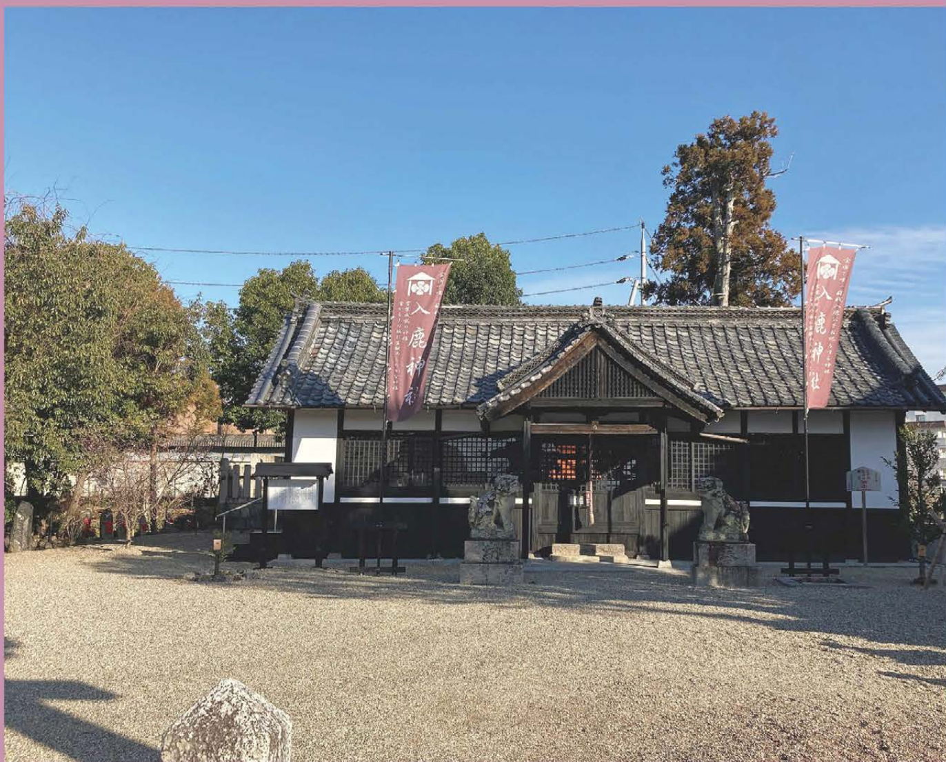
入鹿神社 (小網町335 令和5年1月12日撮影)

入鹿神社は廃寺真言宗高野山派仏起山普賢寺の東南部の一段高い所に西に向かって建ち、もとは同寺の鎮守社であったと伝えられています。祭神はスサノオノミコトと蘇我入鹿の両柱を合祀しています。現在の橿原市周辺は蘇我氏のゆかりの地であり、「蘇我」、「曾我」といった地名も残っています。(一般社団法人橿原市観光協会ホームページより抜粋)