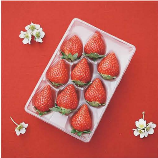
▲発送は専用のバックを使用いたします