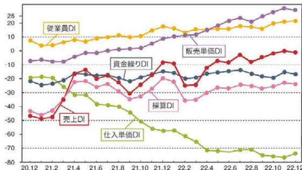
LOBO全産業合計の各DIの推移

※DI値(景況判断指数)について/DI値は、業況・売上・採算などの各項目についての、判断の状況を表す。ゼロを基準として、プラスの値で景気の上向き傾向を表す回答の割合が多いことを示し、マイナスの値で景気の下向き傾向を表す回答の割合が多いことを示す。したがって、売上高などの実数値の上昇率を示すものではなく、強気・弱気などの景況感の相対的な広がりや意味する。DI = (増加・好転などの回答割合) - (減少・悪化などの回答割合)