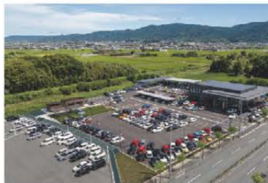
▲店舗全体 (展示車両150台)

また、「車の販売・買取・車検・整備」だけでなく、敷地内にはカフェやドッグランなども併設しており、「ちょっとお茶をしに…」そんな風に気軽に立ち寄りください。