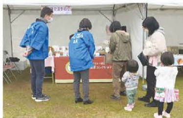
▲説明する異業種交流事業委員

2日間共に榎原ブランド認定事業の事業運営を行う異業種交流事業委員会の委員が、お客様に榎原ブランド認定品の特徴などを説明し販売を行いました。地元榎原市の市民や来場された方に対し榎原ブランド認定品をPRする機会となりました。