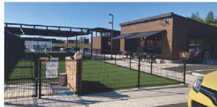
▲ドッグラン&カフェ