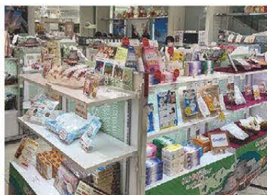
▲榎原商工会議所会員事業所コーナー