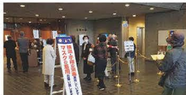
▲女性会による受付の様子

榎原商工会議所は、これからも地域商工業の振興と発展のために、販路拡大に繋がる支援メニューの充実や個々の事業所に寄り添った支援体制等を構築し、「親しめる商工会議所」「行動する商工会議所」として活動してまいります。