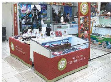
▲榎原ブランド認定品コーナー