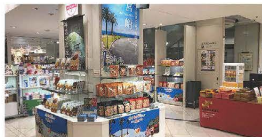
▲宮崎商工会議所会員事業所コーナー