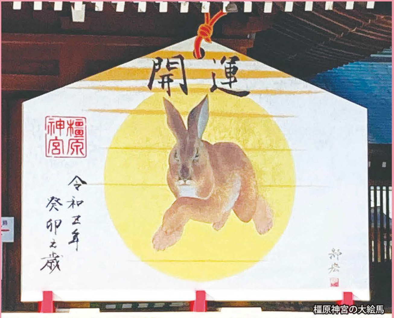
橿原神宮の大絵馬