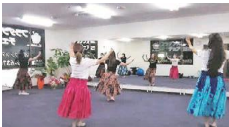
フラ lesson 風景