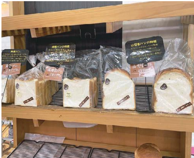
こだわりの食パン

2021年8月に母と息子でオープンしました。 食パンにこだわり、北海道産の「春よ恋」という粉を100%使用した角食パン、前日にお湯で小麦粉をこね、種をつくる湯種食パン、外はカリッと中はふわっと小麦本来の香りがする山型食パンの3種類を取りそろえています。 食パン以外にも老若男女問わず、たくさんの商品から好みのパンを選んでいただけるよう「毎週新商品を1つ出す」ということを目標に、飽きられないパン屋を目指しています。