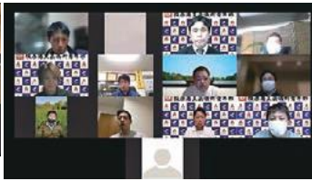
▲役員予定者会議の様子