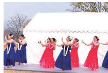
イベント出演 風景

所在地 〒634-0051 榎原市白檀町2丁目13-18 亀喜ビル2階B号 TEL 090-6370-2083 E-mail rmmimico@gmail.com 営業時間 9:00~21:00 定休日 土・日・祝日