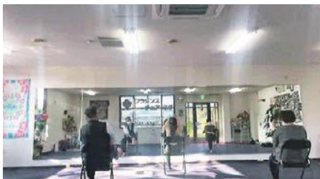
チェアヨガ lesson 風景