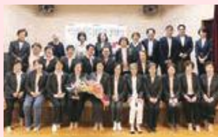
▲昨年の通常会員総会の様子

も、新型コロナウイルスの影響により延期、中止となる場合がございますが、会員の安全を考慮しながら、事業を行って参ります。