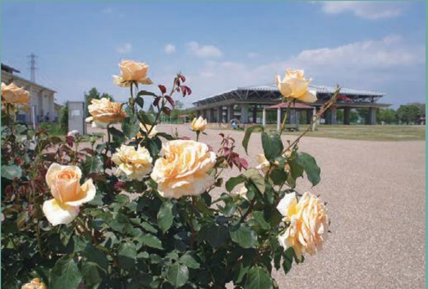
橿原運動公園のバラ園