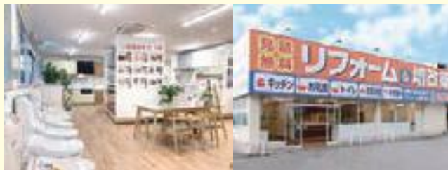
▲ショールーム内観