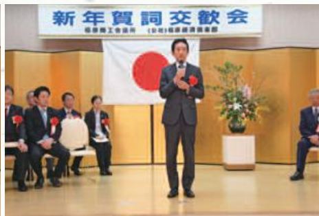
森下市長よりご祝辞をいただきました