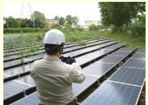
▲太陽電池パネルの点検風景

太陽光発電設備の発電低下を防ぐために定期点検や設備等の不具合調査を行っています。これまで発電低下