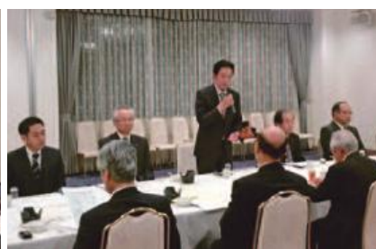
森下市長挨拶の様子