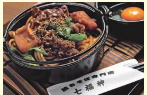
▲食べたらずみつき!!七福神焼きそばをどうぞ。

橿原新ノ口免許センター前に県下初の焼きそば専門店七福神がオープンしました。素材と麺そし