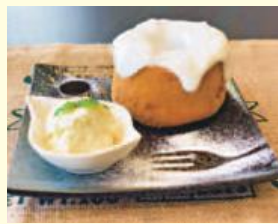
▲お店一番人気の「丸ごとシフォンケーキ」

昨年4月にオープンしましたカフェオルトゥモンです。「オルトゥモン」と言うのは造語になっていて、オルオルと言うハワイ語とロントゥモンというフランス語からとりました。両方心地よいのんびりするといった意味をもつので、そういった空間にしたいと思ったのでつけた名前です。料理はもちろんケーキも手作りなので是非召し上がってみてください。