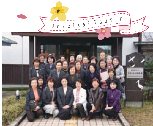
榎原・豊岡商工会議所女性会参加者の皆さん

交流会の後は、コウノトリ文化館でコウノトリの生態や生息する自然環境について展示見学を行い、コウノトリの飛翔する姿も目にすることができました。