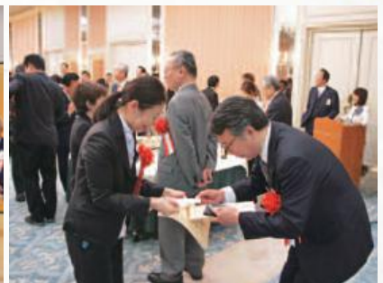
交流を深める参加者