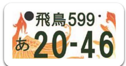
飛鳥ナンバー 最終図柄案 (2020年交付開始に向け準備中)