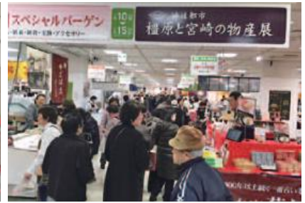
多くのお客様がご来場されました