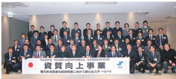
YEG資質向上事業集合写真