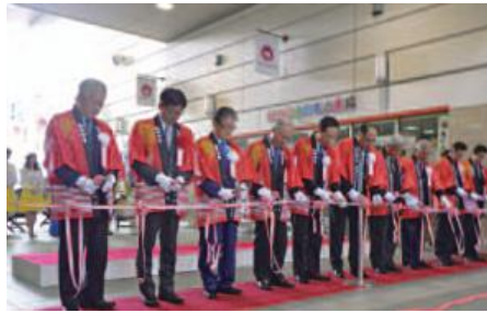
開会セレモニーの様子