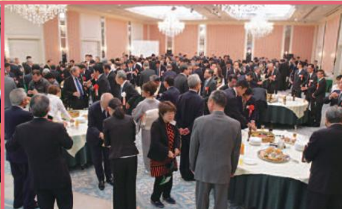
上：地域経済の発展を願って乾杯をする出席者