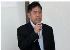
挨拶をされる門長課長