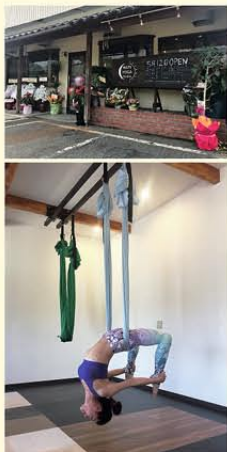
下垂した内臓が元に戻って代謝UP!▲

スタジオ以外でも、企業や飲食店、個人宅への出張ヨガも承っています。また、ご自宅などへのハンモック設備の施工も承ります。