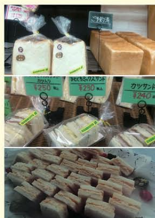
▲ひとくちサンドシリーズが人気です。