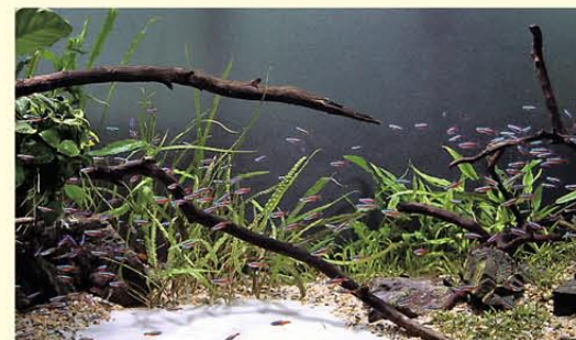
▲白砂を使用し自然なレイアウト

30CUBEは熱帯魚水槽のレンタルサービスを行っております。水槽に関することは、全て当社が行いますので、お客様はきれいな水槽をながめて癒されてください。クリニックや介護施設など癒しの空間を演出いたします。お気軽にお問い合わせください。