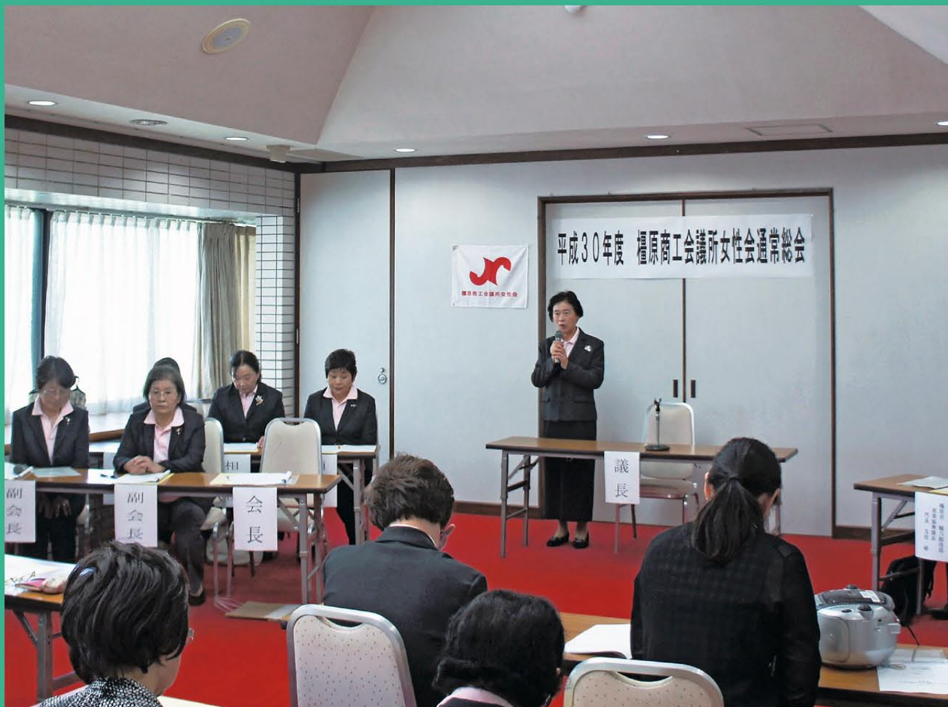
橿原商工会議所女性会通常総会の様子 (詳細記事は P8 をご覧ください)