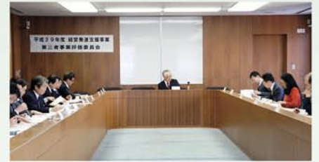
平成29年度経営発達支援事業第三者事業評価委員会

また、「第一期計画は、平成26年に小規模2法が施行されてから平成27年度に作られたと聞いています。期間の短い中で作られた第一期計画については委員の皆様のご意見を頂いた事業評価の言葉を反映していただいて、今後の経営発達支援事業となる2期経営発達支援計画を策定されているものだと認識しています。ご苦労様です。」とねぎらいのお言葉も頂きました。