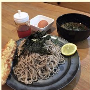
▲冷たい鯛だしつけ蕎麦(ちく天付き)880円

「鯛干し」の特有の香りとクセのないあっさりとした旨みと自然の優しい甘みのある看板メニュー鯛だしらーめんは年代性別問わず人気メニューです。今回新しく鯛だしスープに日本蕎麦を入れたメニューが加わりました。特にオススメは冷たい鯛だしつけ蕎麦です。つけ汁は和と中華を感じる他にない味ですので是非食べて頂きたい新メニューです。