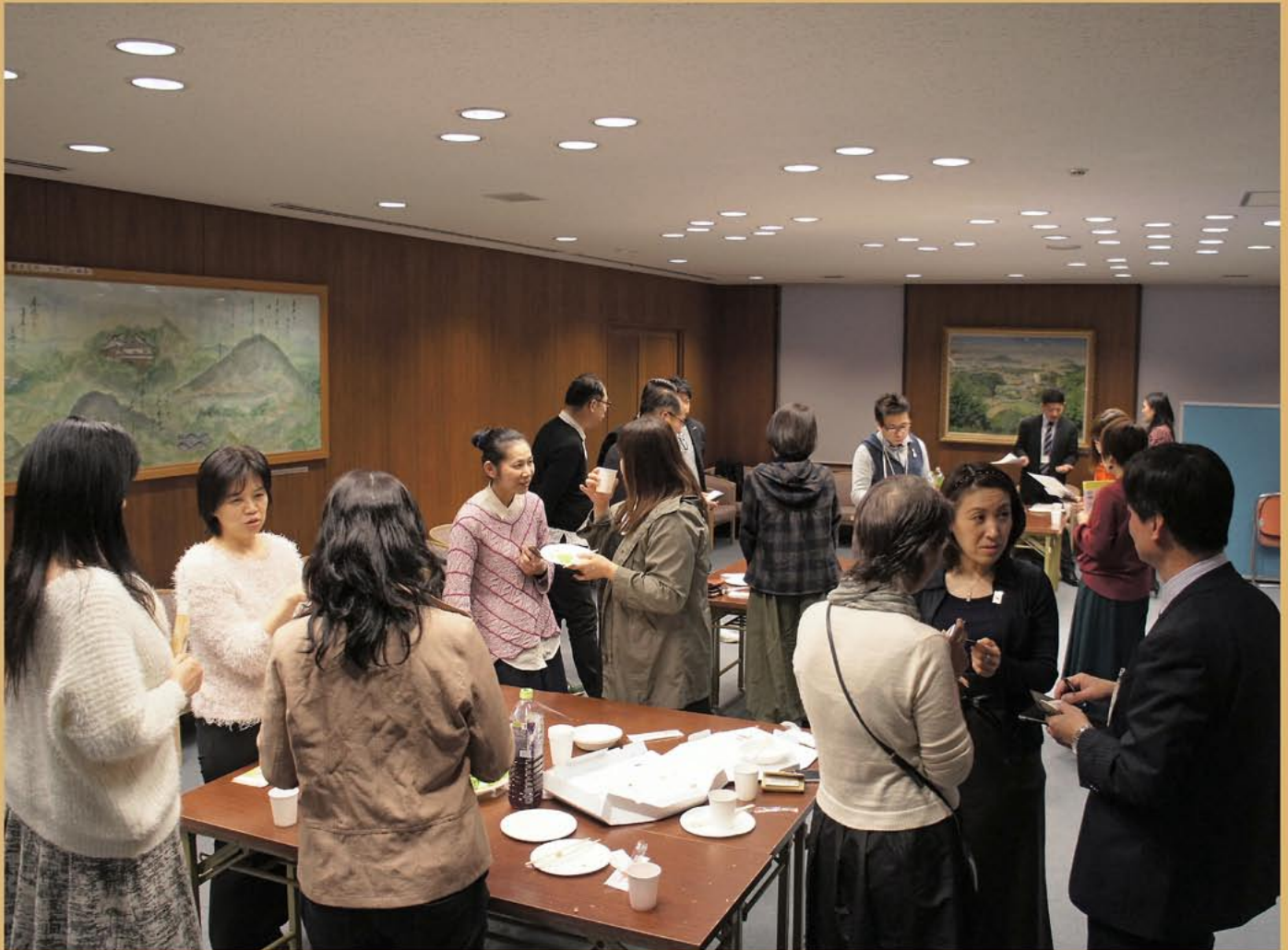
かしはら創業塾受講者による交流会の様子 P9に掲載