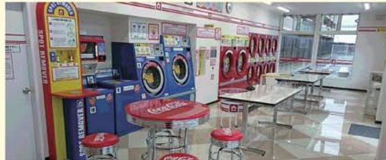
▲明るくて清潔な店内。年中無休、24時間営業です。

全国で大人気のコインランドリー「WASHハウス橿原神宮前店」を昨年末にオープンしました。ピカピカのおしゃれな空間でくつろげます。雨の日や花粉の季節などに大活躍。毛布や布団などの大物洗いが楽にでき、しみ抜き機は無料、スニーカーも専用の機械で洗えます。