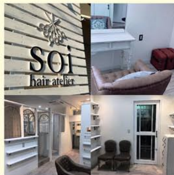
▲真っ白な外観が目印です

開店以来リピーターは9割を超えありがとうございます。今後もお客様のなりたいイメージをカタチにするお手伝いをしてまいります。