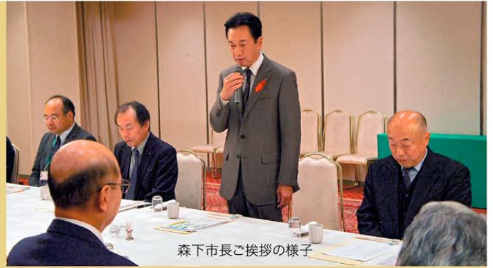
森下市長ご挨拶の様子