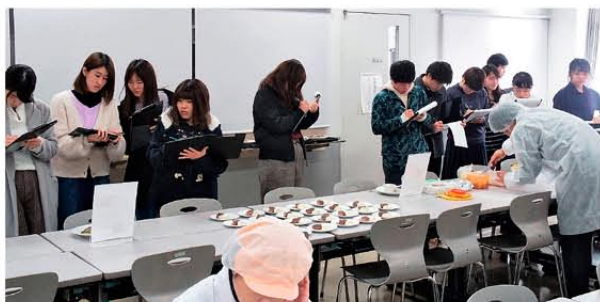
畿央大学での試食会