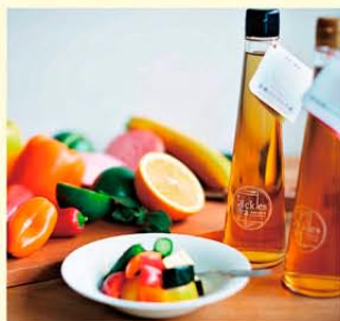
▲甘くてまるやかな黒酢のピクルス液ぜひお試しください!

当店では、ピクルス液を通して、手間や時間をかけすぎず、ピクルスを作り簡単に、彩のある食卓を楽しむことができたなら…そんな幸せのお手伝いができればと思っております。ピクルス屋の商品は化学調味料、保存料など一切使わず、ほかにはない絶妙な「まるやかさ」が魅力です。