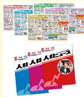
▲弊社発行新聞折込求人誌及びフリーペーパー

経営者の悩みは“人手不足”県内の求人は完全に売手市場に傾き、なかなかご希望の人材が採用出来ないのが実情ではありませんか。弊社は市内で人材サービス業約40年の実績、地元密着で活躍している会社です。人手不足のお悩みを県下一番の発行部数を誇る求人誌でお手伝いすると共に、優秀な高年齢層の活用や女性人材の活用について様々な相談も承っております。