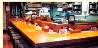
▲ご来店をお待ちしております。

料理の種類を豊富に揃えており、なんと言っても各メニューの量や味付けを好みに応じて変えられるというサービス・裏メニューもあり、融通をきかせていただくところが喜ばれています。