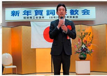
森下市長よりご祝辞をいただきました