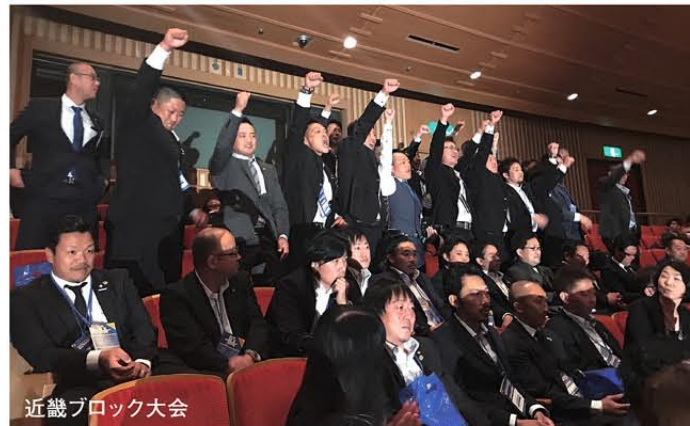
近畿ブロック大会