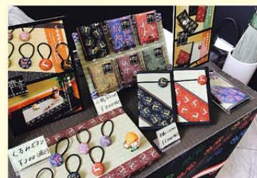
▲畳縁を使用した和小物

弊社は日本の伝統産業である「国産畳」の製造を大正10年（創業96年）より営む老舗。今は後継者四代目として、三代目である父親の技術を傳承しながら親子二名体制で営業しております。今後の新たな展開として、「奈良にシカない」当店オリジナル畳縁（たたみべり）「和鹿奈 WAKANA」を使用した畳の和小物を製作・販売していきたいと考えています。