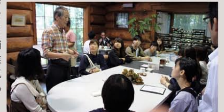
研修会での店舗訪問

平成29年9月23日(土)平成29年度産学官連携事業「かしはら逸品創出プロジェクト」の開始に向けた、畿央大学生への研修会を檀原市内で行いました。今年は「ふるさと名物」となりうる「かしはらの逸品」を学生と一緒に協力して作り上げていただく参加事業所7店舗を訪問し、各事業所の特徴や雰囲気を感じ取りました。