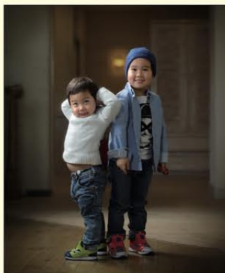
▲2016年第62回全国展 推薦文部科学大臣賞

当写真館では、お客様の人生を責任を持って写真に残すことで、ご家族の絆をつなぎます。そのため大切にしているのが、まずプロとしての技術です。光と影を操り、人物をより立体的に美しく描いて「品のある」写真を目指します。また笑顔の写真が全てではなく、その1枚から会話がかえり、その人らしさを引き出します。