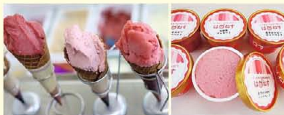
▲各種ジェラート・シャーベット

ジェラートとは、イタリア風のアイスクリーム。果汁や果肉をふんだんに使っているので風味が濃厚でありながら乳脂肪分が少なく低カロリー。人気の苺(あすカルビー・古都華)をふんだんに使用しているので、口あたりがやさしく後味すっきり。果実や野菜の皮や種をとるところから手間暇をおしまず作ったジェラートの味と香りをそのままに味わえます。