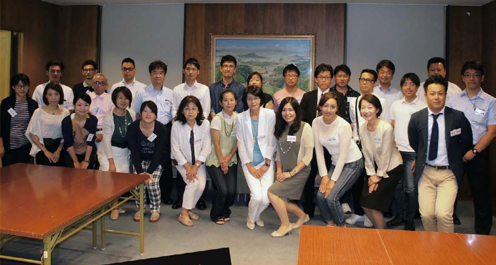
写真/かしはら創業塾参加者と講師のみなさん。P11に掲載