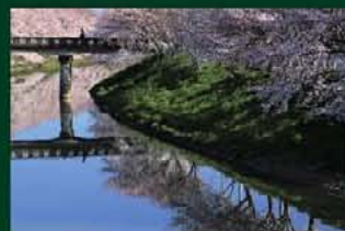
平成25年フォトコンテスト 最優秀賞作品「川面映ゆ」