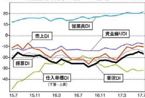
LOBO全産業合計の各DIの推移 (2015年7月以降)

※DI値は、売上・採算・業況などの各項目についての、判断の状況を表す。ゼロを基準として、プラスの値で景気の上向き傾向を表す回答の割合が多いことを示し、マイナスの値で景気の下向き傾向を表す回答の割合が多いことを示す。したがって、売上高などの実数値の上昇率を示すものではなく、強気・弱気などの景気感の相対的な広がり意味着。