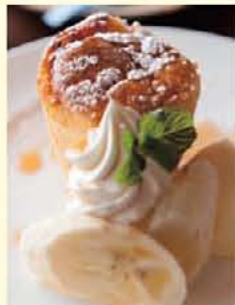
▲ふわふわしっとりマフォンケーキ