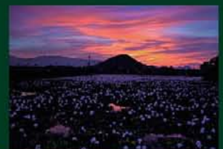
平成23年フォトコンテスト 最優秀賞作品「残照」