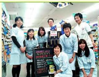
▲体の源「天然のアミノ酸」レバコール

天然アミノ酸がたっぷり入ったレバコールで地域の皆様を元気にします!木のうたのレバコールで元気になるって下さい。いつもご来店をお待ちしています。