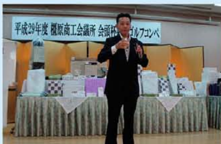
木原商業部会長(幹事部会)の挨拶

親睦ゴルフコンペは、普段ではなかなか接する機会のない会員同士の交流を図る絶好の機会になりました。