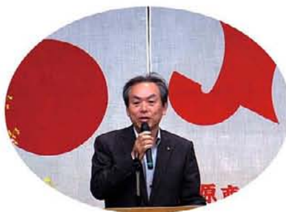
ご祝辞を頂いた岡崎副市長様