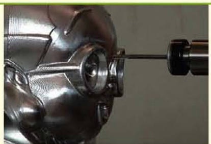
▲最新の加工技術を日々磨いております。

当社はマニシング加工、NC複合旋盤、ワイヤー放電、平面研磨、三次元測定器の最新設備を設置し、各種産業機器と精密機械部品の製造を行っております。永い歴史の中で培った高い技術と最新設備をそろえ、環境改善においてもKES(環境マネジメントシステム)STEP2SRを取得。「技術・設備・環境」をコンセプトに高い信頼を得ております。