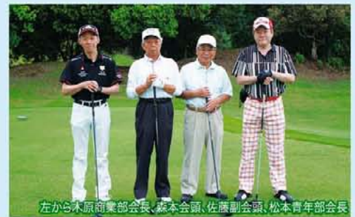
左から木原商業部会長、森本会頭、佐藤副会頭、松本青年部会長