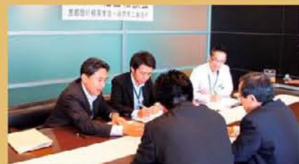
経営相談会の相談対応の様子

を7月12日(水)、奈良中央信用金庫榎原支店において実施を予定しております。金融に関する相談、経営に関する相談だけでなく、お悩みのことがあれば何でも結構です。相談会へのお申込みをお待ちしております。