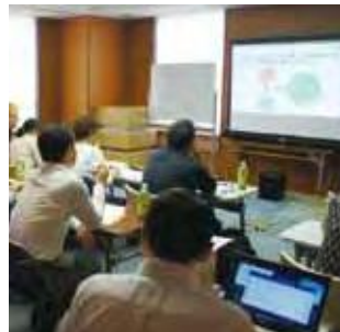
かしはら観光塾講義の様