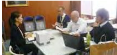
(株)ヤマトとの商談