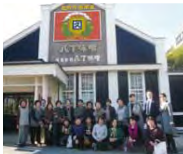
カクキュー本社事務所前にて

平成28年11月11日(金)から12日(土)にかけて女性会会員19名にて愛知県方面に一泊研修会を行いました。両日とも天候に恵まれ、1日目は岡崎市の八丁味噌の郷カクキューにて味噌蔵見学を行い、八丁味噌の名前の由来や製造方法について説明を受けました。2日目は長島町のなばなの里にてベゴニアガーデンとイルミネーションを見学し、帰路につきました。今回の研修では、女性会会員同士の親睦を大いに図ることが出来ました。