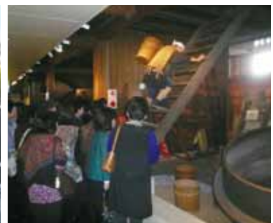
資料館見学の様子