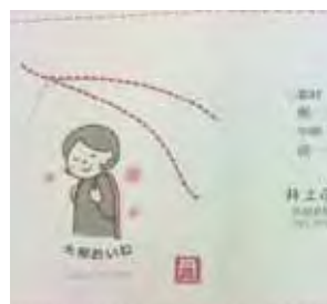
↑ 大和おいねパンフレット

※大和おいねは「新沢千塚ふれあいの里」や「道の駅 宇陀路大宇陀 阿騎野宿」でもお買い求めいただけます。