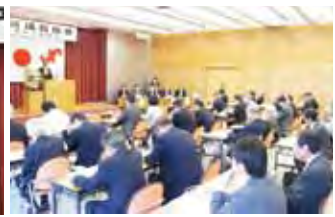
臨時議員総会の様子