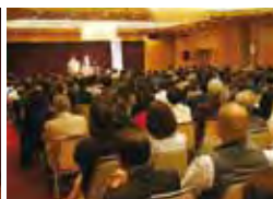
聴講者で一杯の会場