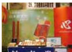
グランプリのブース(デザイン)