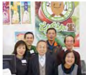
↑ スタッフと出荷者のみなさん