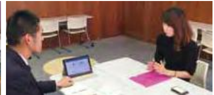
読売ファミリーとの商談