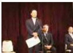
来賓の浪越副知事