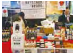
ミニ物産展ブース