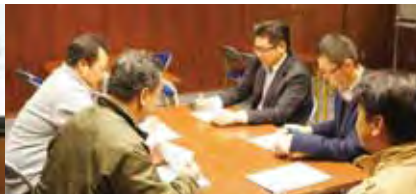
グループ論議の様子