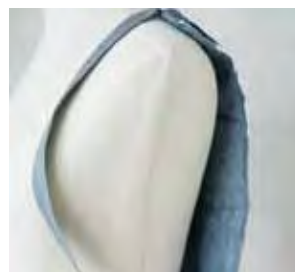
↑ 防寒着として使用していただけます